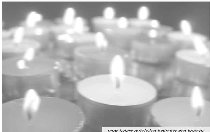
voor iedere overleden bewoner een kaarsje